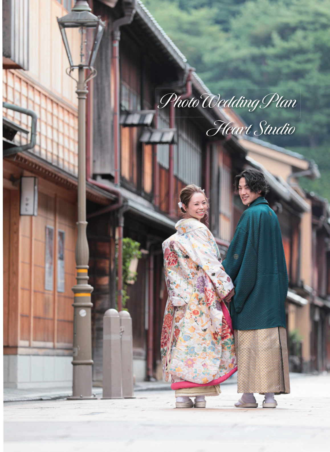
Photo Wedding Plan Heart Studio